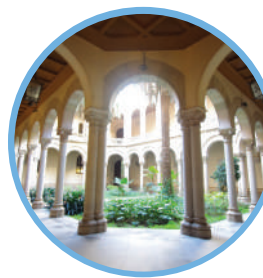
POSTGRAU EN HISTÒRIA I ART CRISTIÀ