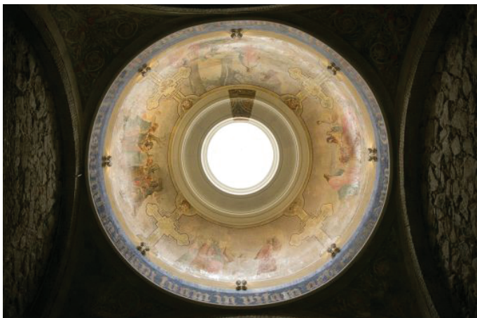
Pintures descobertes a la volta de la Capella del Santíssim

Aquesta II Jornada sobre "Les Basíliques Històriques de Barcelona" està dedicada a la Basílica dels Sants Màrtirs Just i Pastor. Les investigacions arqueològiques dutes a terme els darrers set anys han permès situar els seus orígens al segle VI, conèixer la seva evolució i retornar a la basílica el paper cabdal que va tenir a l'època visigoda. D'altra banda, el projecte de rehabilitació de l'edifici gòtic ha permès posar en valor elements patrimonials que restaven amagats.